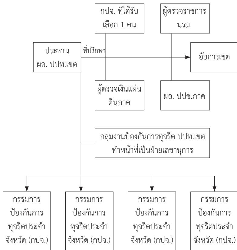
แผนภาพที่ 1 แสดงโครงสร้างของ “ศูนย์ประสานงานเครือข่ายภาคประชาสังคมในการต่อต้านการทุจริตเขตพื้นที่”

ส่วนในระดับจังหวัดให้มีกรรมการป้องกันการทุจริตประจำจังหวัด เรียกโดยย่อว่า กบจ. ทุกจังหวัด และให้มีโครงสร้างของศูนย์ประสานงานเครือข่าย ประกอบด้วย 1) ประธาน กบจ. ซึ่งมาจากการเลือกตั้งกันเองภายใน กบจ. 2) กลุ่มงานป้องกันการทุจริต ปปท.เขต เป็นฝ่ายเลขานุการโดยกำหนดให้มีอัตรา